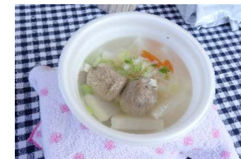
初参戦 つみれ汁 364杯！