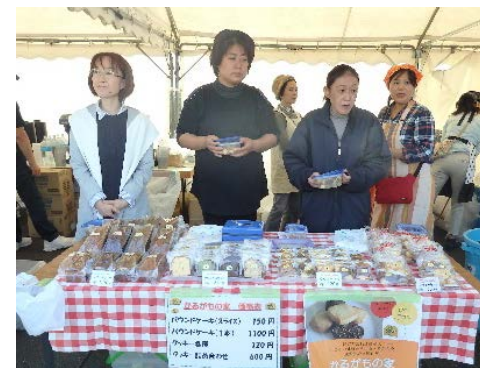
「かるがもの家」クッキーとパウンドケーキ

横浜刑務所で毎年開催される矯正展に「かるがも会」は今年も出店しました。かるがもの家のクッキーやパウンドケーキ、パステルのお赤飯や炊き込みごはん、コーポあおぞら・WAIWAI コーポからはフランクフルト、そしてかるがも会として、つみれ汁・コーヒーの販売をしました。