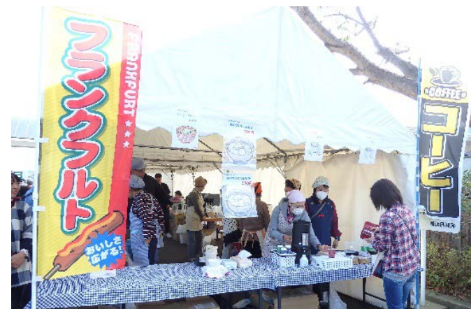
コーヒーはのぼりを作り、305杯販売