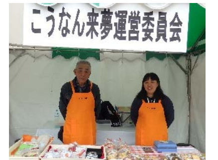
こども夢ワールドでも販売