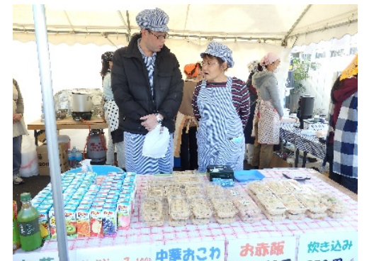
「パステル」炊き込みごはん・お赤飯・中華おこわ・ジュース