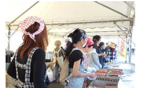
フランクフルト焼いています 534本売れました