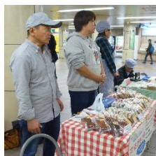
地下鉄上大岡駅での定期販売 常連のお客さまもいてくださいます！

また、港南区役所や上大岡駅、地区センター、蓬萊荘、ケアプラザなどでも販売していますのでどうぞご利用ください。