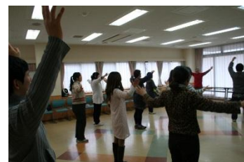
(皆で踊ったフラダンス☆)